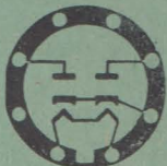
7 Z 4